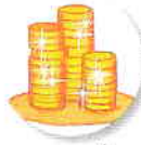
monede de aur